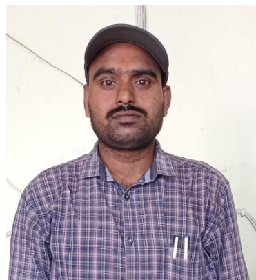
DIGITAL PHOTOGRAPH :